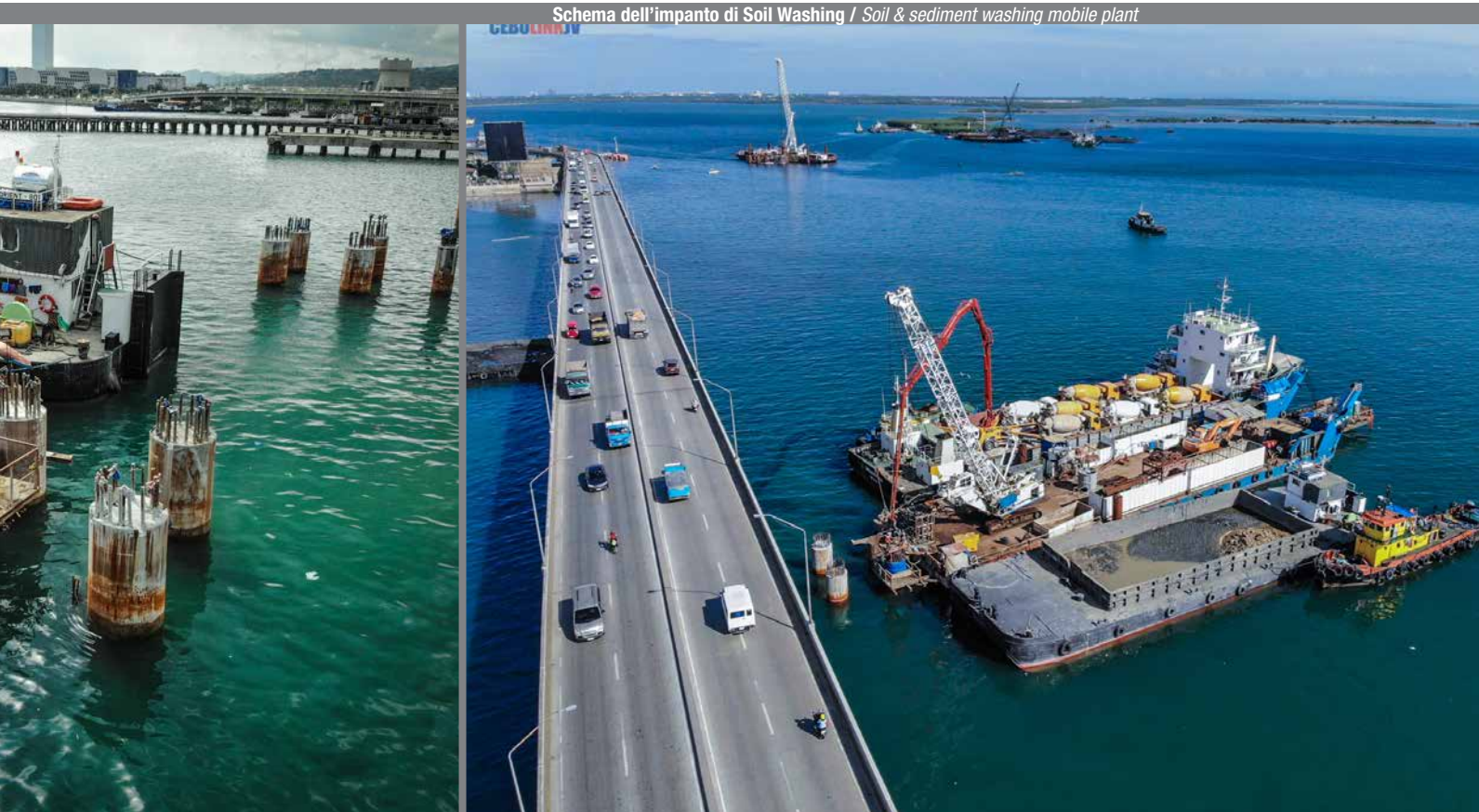
Schema dell'impianto di Soil Washing / Soil & sediment washing mobile plant